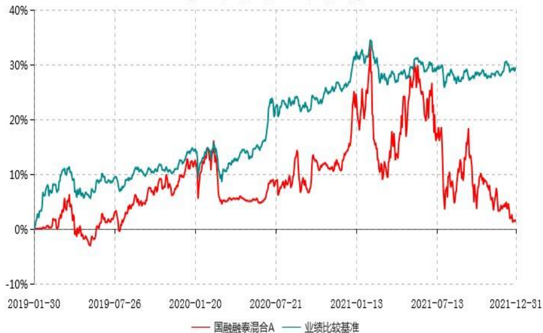
国融融泰混合A累计净值增长率与业绩比较基准收益率历史走势对比图 (2019年01月30日-2021年12月31日)