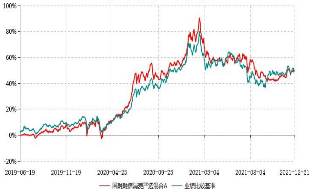
国融融信消费严选混合A累计净值增长率与业绩比较基准收益率历史走势对比图 (2019年06月19日-2021年12月31日)