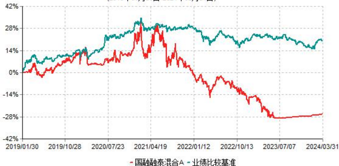
国融融泰混合A累计净值增长率与业绩比较基准收益率历史走势对比图 (2019年01月30日-2024年03月31日)