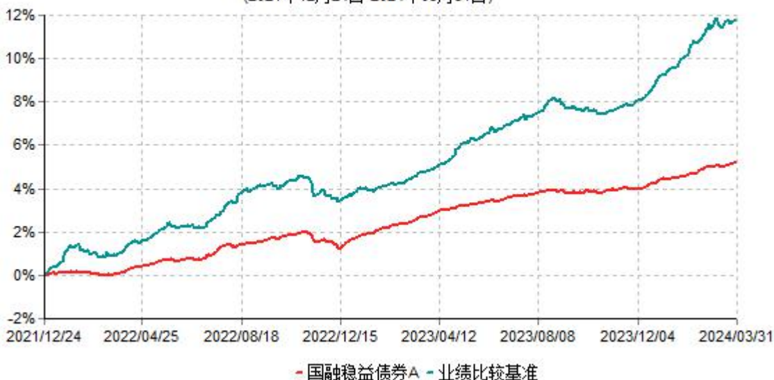
国融稳益债券A累计净值增长率与业绩比较基准收益率历史走势对比图 (2021年12月24日-2024年03月31日)